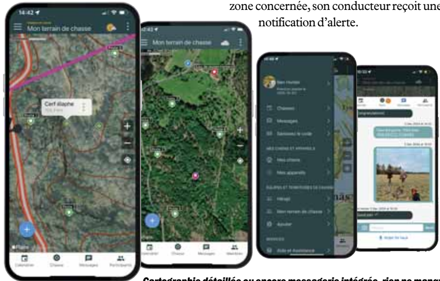
Cartographie détaillée ou encore messagerie intégrée, rien ne manque.

ligne droite la distance qui le sépare de ses voisins de poste ou de tout autre obstacle. Enfin, outre l'aspect humain, WeHunt permet de sécuriser les chiens équipés de colliers de repérage.